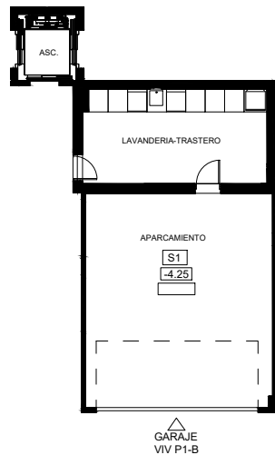
PLANTA SÓTANO. VIVIENDA 1-B ESCALA:1 : 150