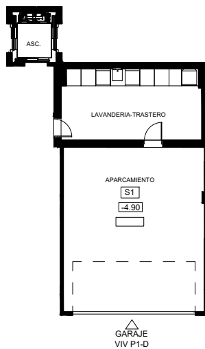
PLANTA SÓTANO. VIVIENDA 1-D ESCALA:1 : 150